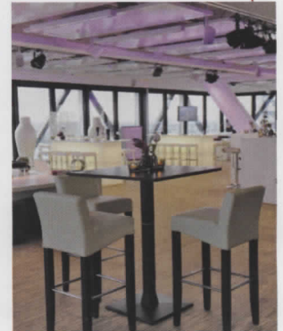
Stylischer New-York-Flair auf Level 9 des „Upside East“